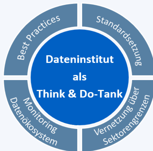
Abbildung 1: Mögliche Funktionen gemäß Zwischenbericht der Gründungskommission vom 09.12.22

Monitoring des Datenökosystems bzw. Übersicht über die wichtigsten Akteure und Initiativen. Die Kenntnis der relevanten Initiativen und Stakeholder im Datenökosystem ist Voraussetzung für die erfolgreiche Arbeit des Dateninstituts, insb. auch, um das Datenteilen über Sektorengrenzen hinweg zu befördern.