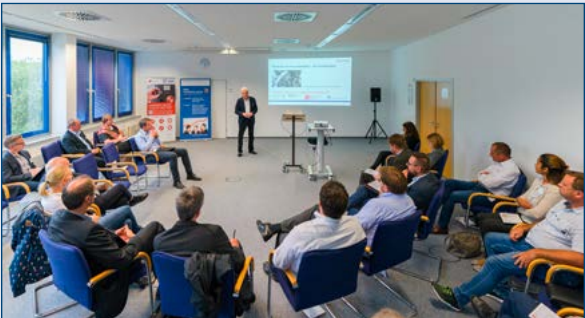
Unternehmertreffen 2019