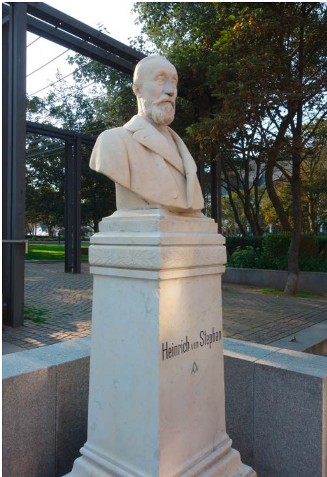
Generalpostmeister Heinrich von Stephan