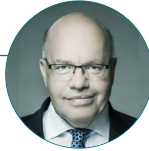
PETER ALTMAIER BUNDESMINISTER FÜR WIRTSCHAFT UND ENERGIE

Die Präsidentschaft hat das Recht, die Tagesordnung der Ministerräte und ihrer Vorbereitungsorgane festzulegen. Und sie ist für die Ausformulierung von Kompromissvorschlägen in laufenden Gesetzgebungsverfahren zuständig. Außerdem vertritt die Präsidentschaft den Rat der Europäischen Union nach außen. All dies ermöglicht der Präsidentschaft gewisse Gestaltungsspielräume.