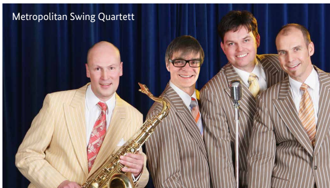
Metropolitan Swing Quartett