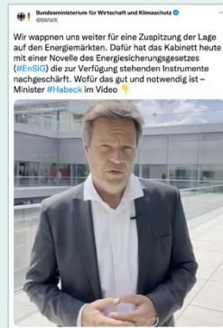
#ENERGIESICHERUNGSGESETZ Bundesminister Habeck erklärt, wie die Novelle des Energiesicherungsgesetzes die Versorgungssicherheit stärkt.