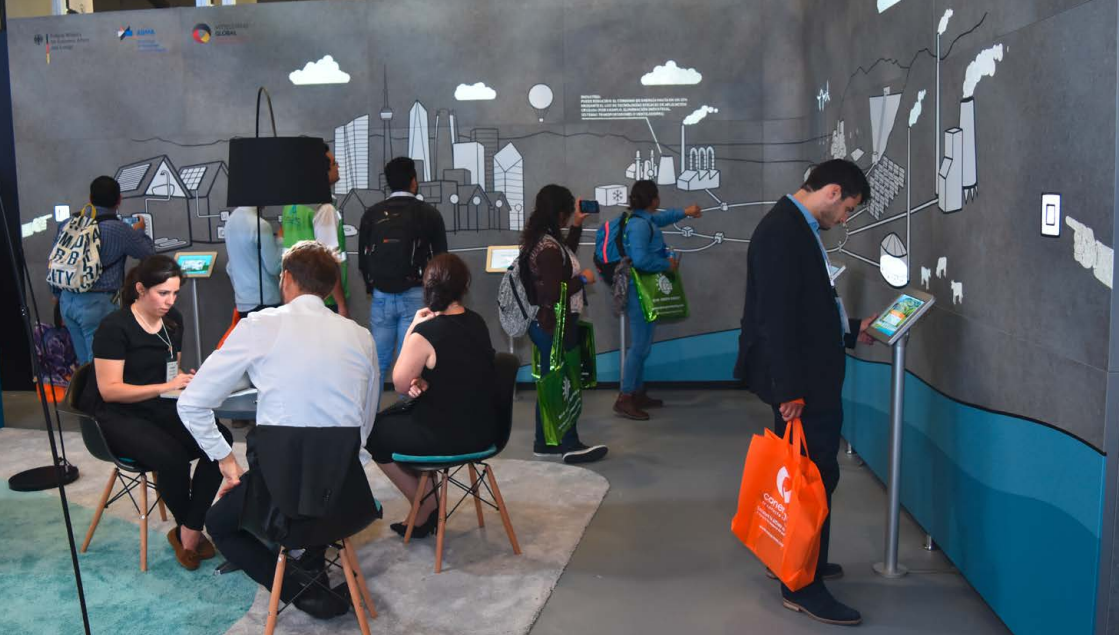
Smartwall des Auslandsmessestandes