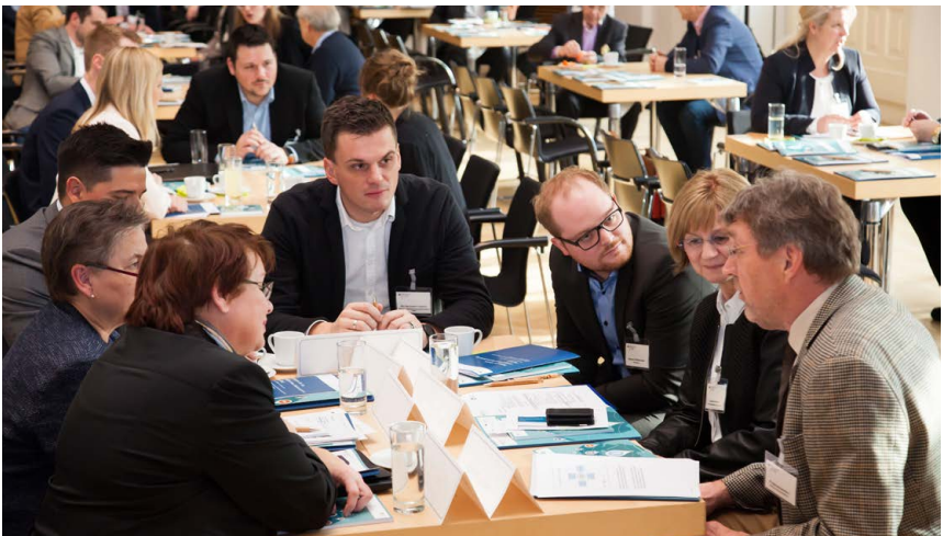
Fachveranstaltung im BMWi zum Thema Strategien für den Markteintritt

Die Fachveranstaltungen im BMWi werden von der Geschäftsstelle der Exportinitiative Energie durchgeführt. Die Veranstaltungsdokumentation finden Sie auf unserer Webseite unter www.german-energy-solutions.de .