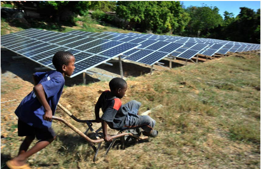
Projektentwicklungsprogramm in Afrika