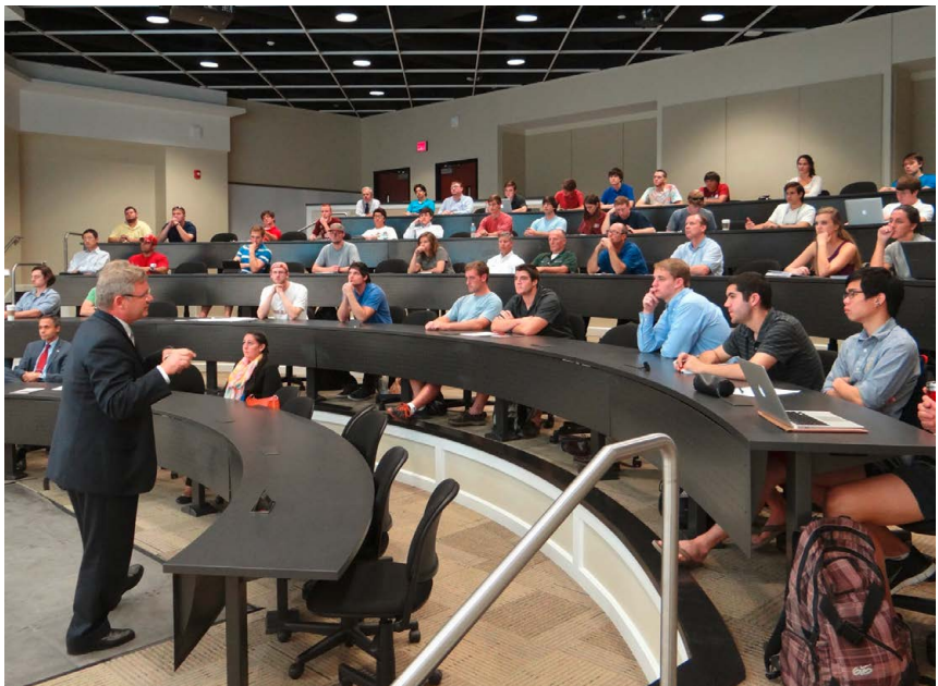
Innovationsseminar in den USA zum Thema Gebäudeeffizienz

Die Innovationsseminare werden von der jeweiligen Auslandshandelskammer durchgeführt.