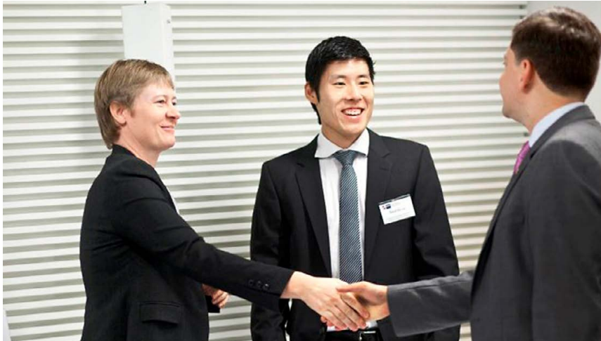
AHK-Geschäftsreise zum Thema Gebäudeeffizienz nach Australien und Neuseeland

Darüber hinaus haben Sie die Möglichkeit, Ihre Produkte oder Dienstleistungen auf einer eintägigen Fachkonferenz Vertretern aus Wirtschaft, Verbänden, Verwaltung und Politik im Zielland zu präsentieren.