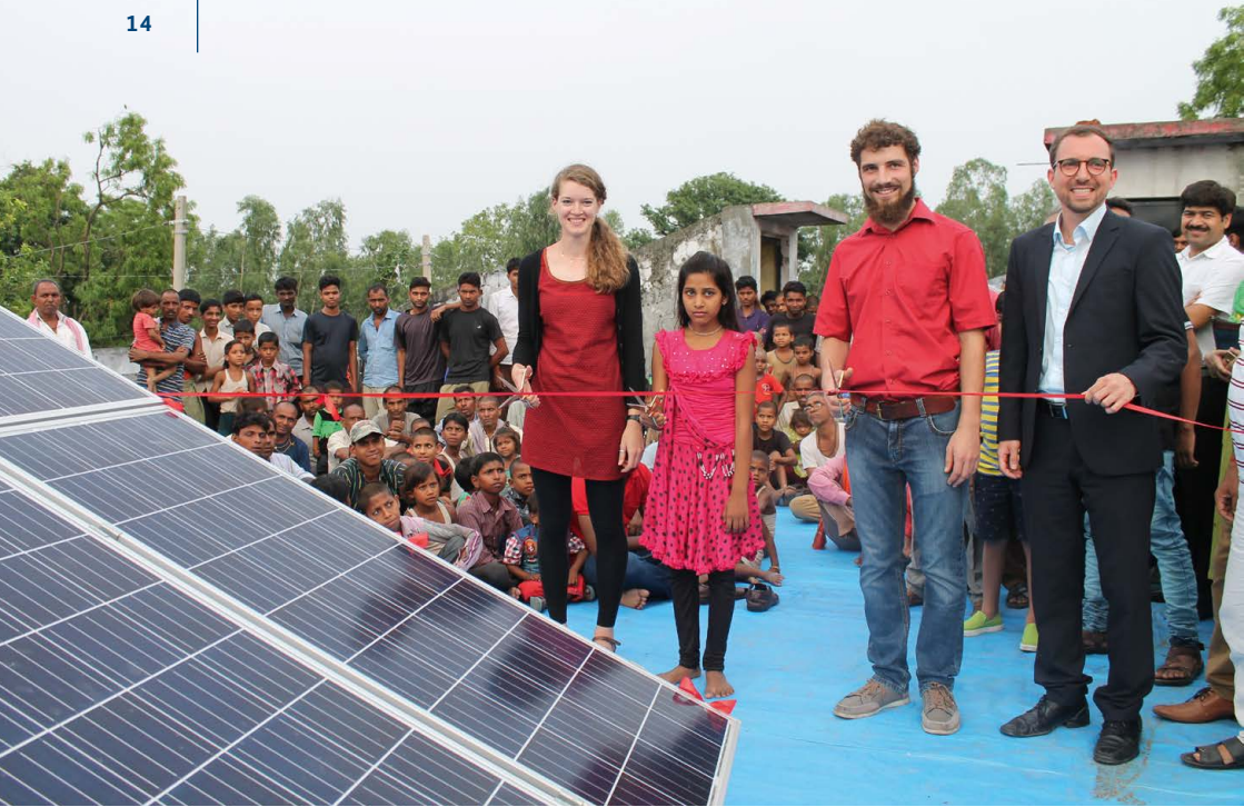
dena-RES-Projekt in Indien