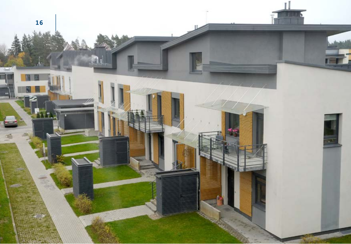
Leistungsschau zu Gebäudeeffizienz im Baltikum